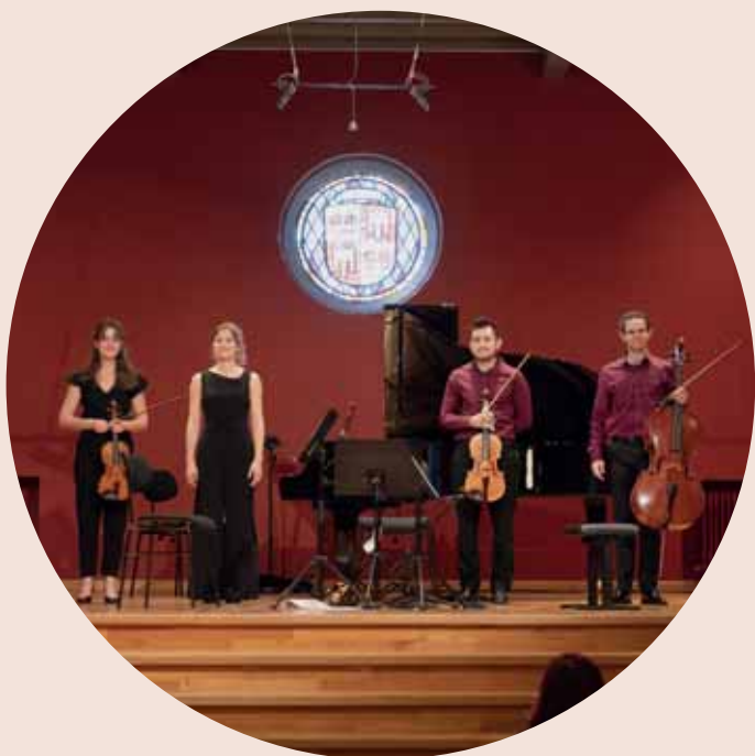
1. ERLEBE SOL