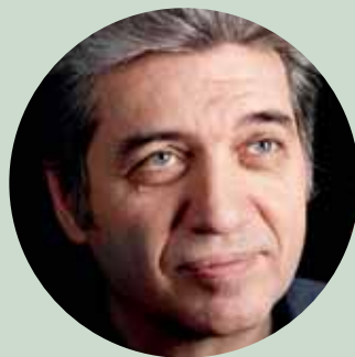
Sreten Krstić Langjähriger Konzertmeister der Münchner Philharmoniker