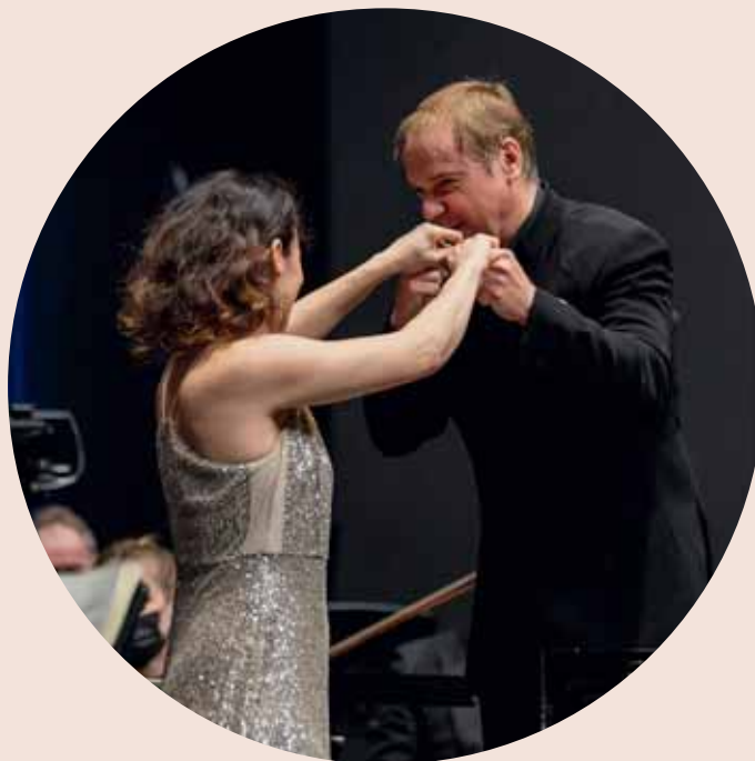
1. SOL im SAL

Das Motto der 34. Konzertsaison 2022 lautete „Comeback“. Es stand nicht nur für die Rückkehr zahlreicher Künstlerinnen und Künstler zum Sinfonieorchester Liechtenstein, sondern war auch ein Aufruf, den Konzertsaal wieder mit Applaus und echter Livemusik zu beleben.