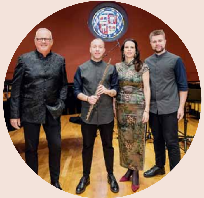
4. ERLEBE SOL