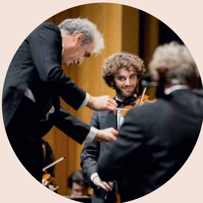
2. SOL im SAL