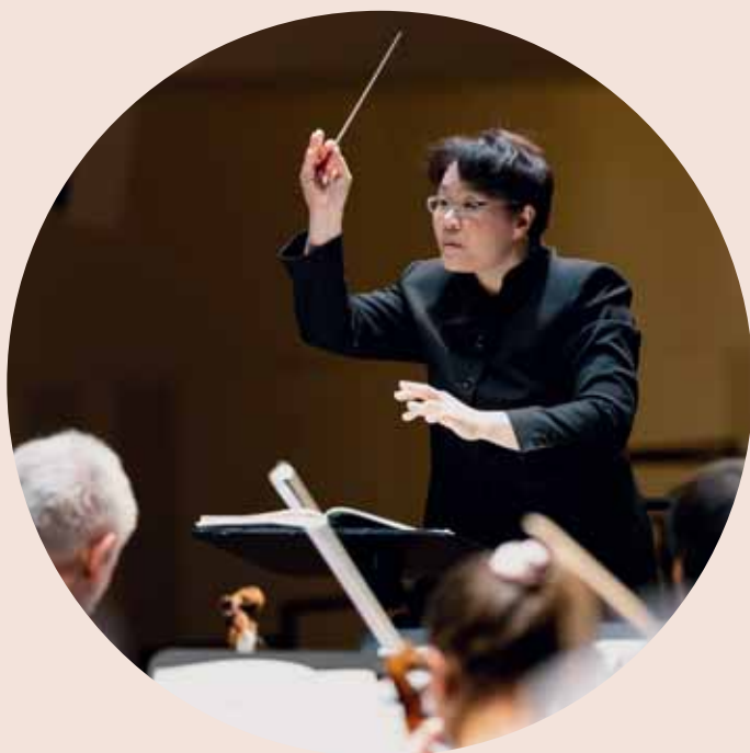
TAK - Vaduzer Weltklassik-Konzert