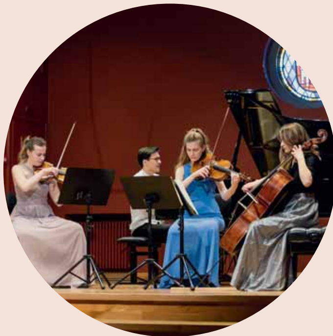
2. ERLEBE SOL